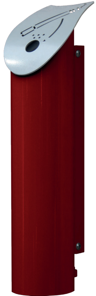
Cendri'rue personnalisé en RAL 3004

Exemple de personnalisation : Cendri'rue RAL 9003 + sticker façon « mégot »